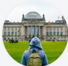
Actions Jean Monnet