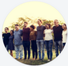
Partenariat de coopération